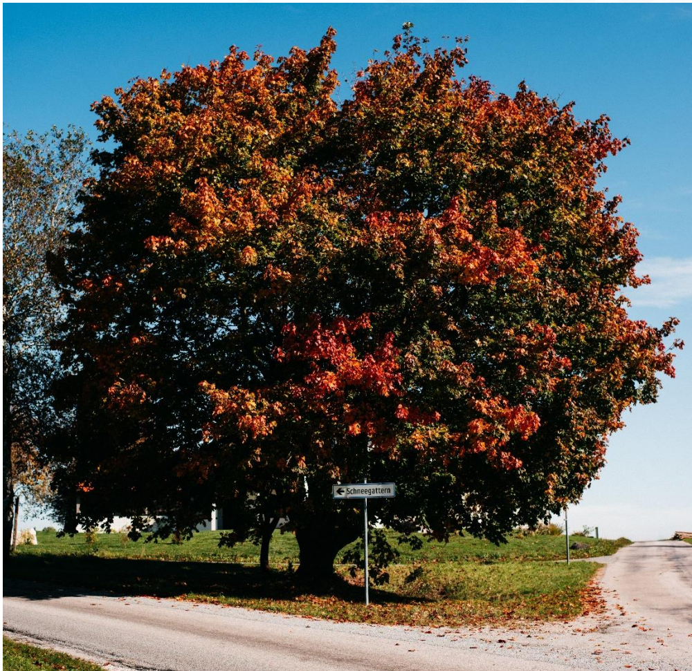
Das oberösterreichische Unternehmen mafi mit Sitz in Schneegattern setzt auf Regionalität, Nachhaltigkeit und Wohngesundheit.